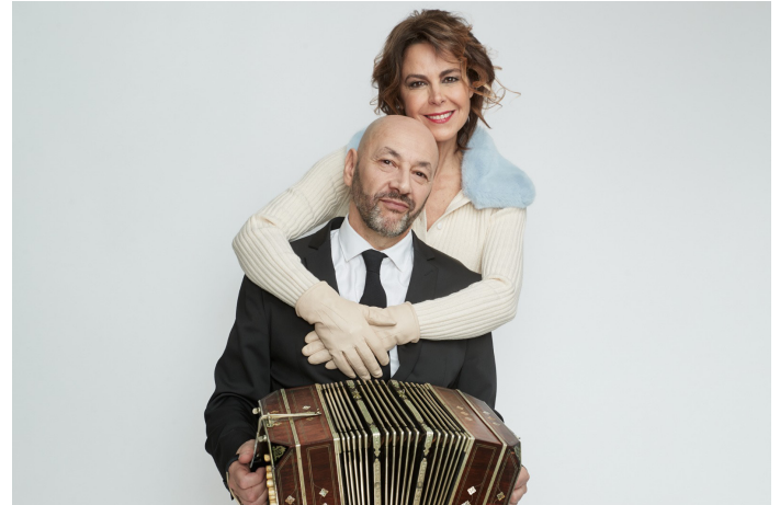
Blanca Oteyza Actriz y productora