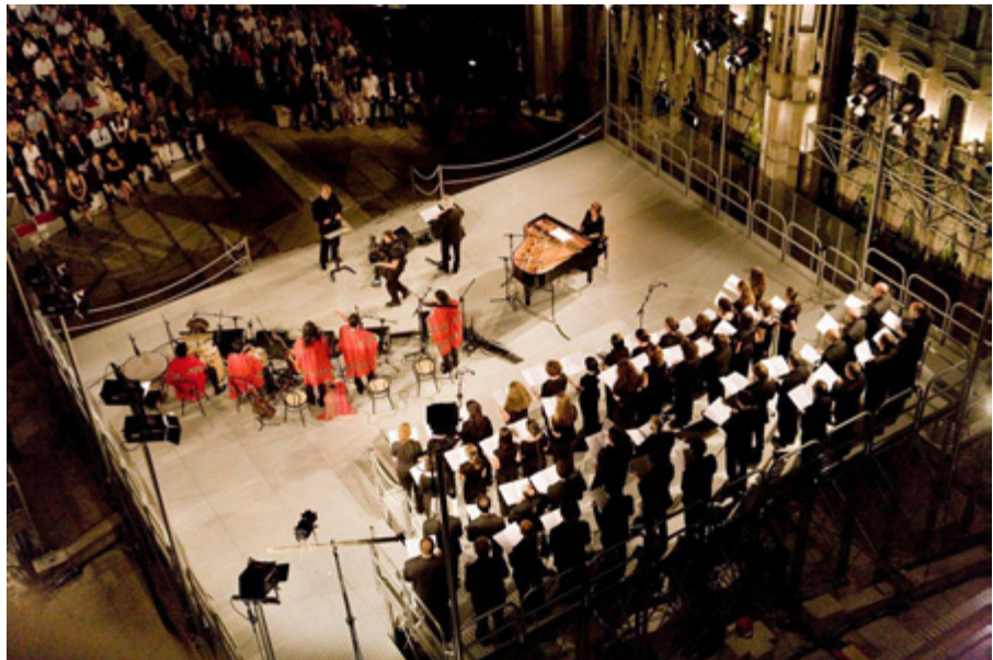
Duomo de Milán Concierto en Julio de 2010 junto a José Carreras