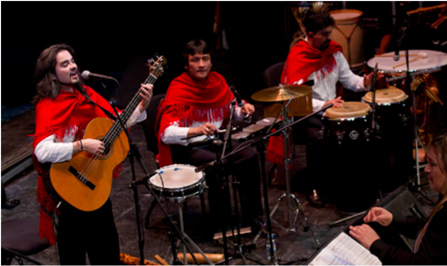
Teatro Cervantes de Málaga Durante el estreno en 2012